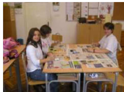
„božanski posao – izrada anđelčića“

uporabnih predmeta - pokazalo se da smo i izvrsne prodavačice jer smo velik dio izložaka uspješno prodale. Na našem je štandu bilo veselo i zabavno.