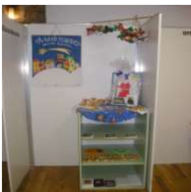
„Gdje je nestao čovjek?“

Svake godine, pa tako i ove, u prosincu se u Skradu održava međunarodni Gorski sajam. Osim raznolikosti izložaka i izlagača koji se predstavljaju ekološkim proizvodima uglavnom Gorskog kotara: šumskim voćem, likerima, pekmezima i sl. , izlažu se i rukotvorine, ručni radovi u drvu, tkanini i vuni. Mi smo Školu predstavile gipsanim odljencima anđela te ručno izrađenim čestitkama i ukrasima za bor. Izložke su izradili članovi ekološke grupe. Osim što smo vrlo kreativne u izradi malih,